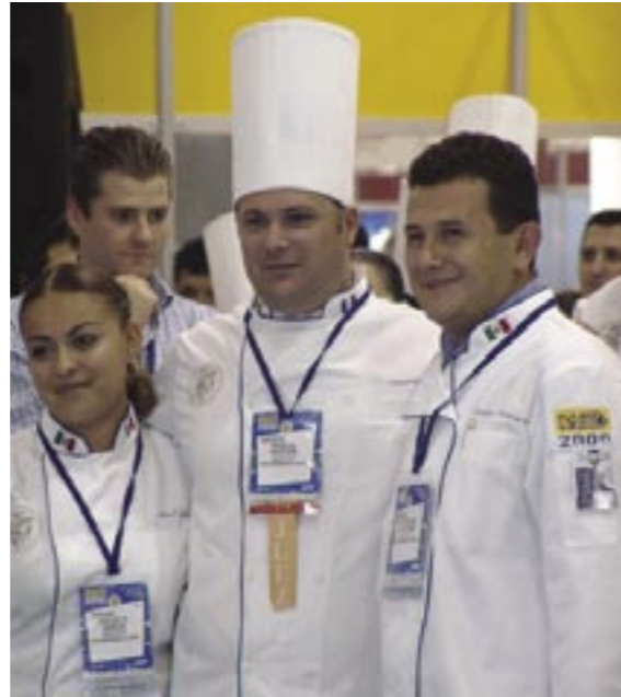
Abastur convoca a participar en 3 competencias que exponen la exquisita sensibilidad y talento de los involucrados.

El "Gran Concurso de Pastelería y Figuras Artísticas de Chocolate Latinoamericano Copa Maya "Final Nacional", pretende apoyar al desarrollo de los profesionales de la Pastelería a nivel Nacional e incitar la camaradería donde demostrarán sus habilidades. Los participantes deben de formar agrupaciones de 3 reposteros, no hay límite de edad, pero sí de nacionalidad, que debe ser mexicana. El Equipo que resulte triunfador de la Final Nacional será quién represente a México en la Copa Maya Latinoamericana 2008 y los