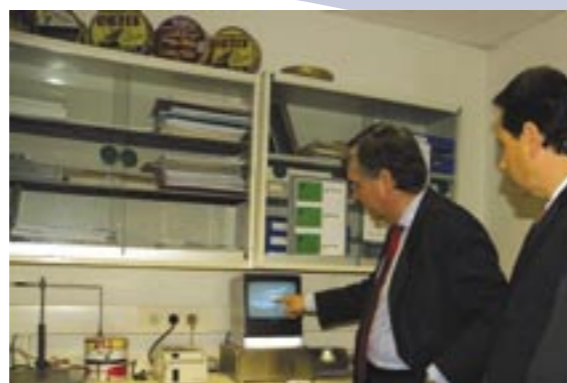
Visit to the Collaboration Agreement entered into with the National Seafood Cannery Association of Spain (ANFACO) facilities. Visita a las instalaciones de Asociación Nacional de Fabricantes de Conservas de Pescados y Mariscos de España (ANFACO)

The Center's representatives explained that they help members of public administrations of other countries that summon them to analyze the problems of different regions, as well as businessmen who are looking for consulting services for their companies.