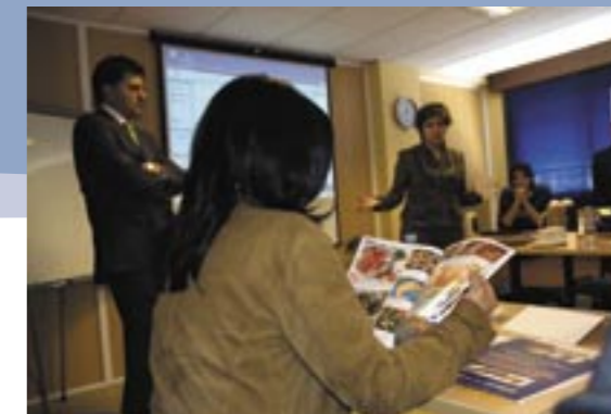
The members of the business mission saw large possibilities with Coaxis for their products. Los miembros de la misión de negocios vieron grandes posibilidades con Coaxis para sus productos.

*Patrizia Loru is a collaborator of Seafood Today in Spain.