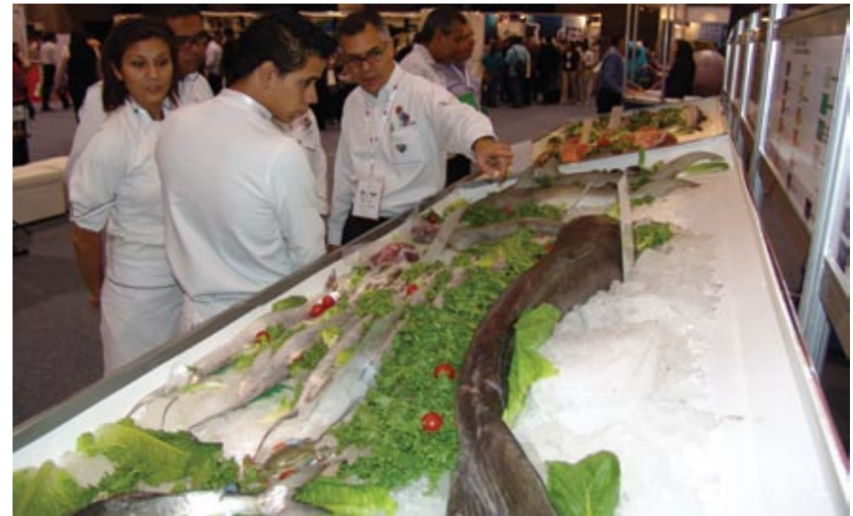
COMEPESCA showcased the most marketed ocean products in Mexico. COMEPESCA, mostró los productos del mar de mayor comercialización en México