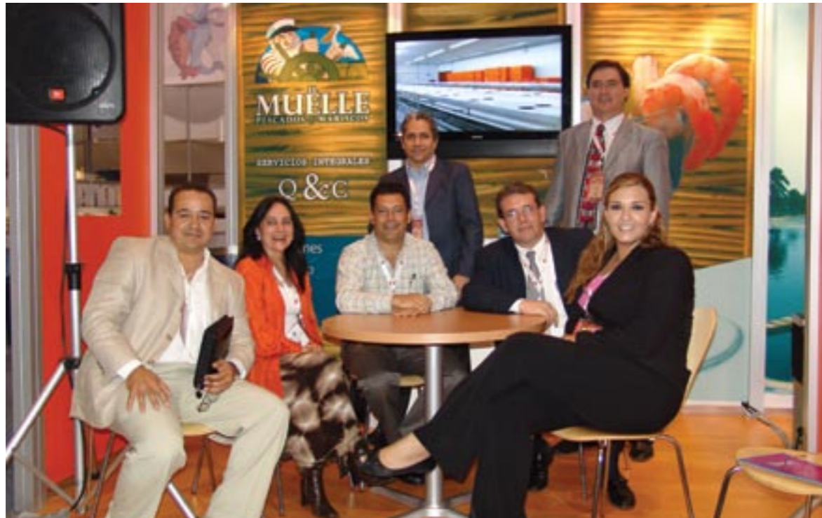
Marpac presented the products that they distribute in Mexico, mainly Mexico City, Queretaro and Jalisco. Marpac presentó sus productos que distribuye a nivel nacional, principalmente Distrito Federal, Queretaro y Jalisco.

Due to its importance for the industry, Pescamar is one of the largest events furthering seafood consumption in Mexico, The Business Lounge, set up by the Federal Government through SAGARPA, provided an attractively designed space for negotiating, which featured wireless Internet service and beverages.