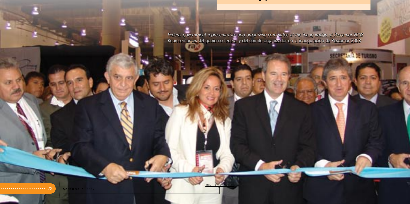
Federal government representatives and organizing committee at the inauguration of Pescamar 2008 Representantes del gobierno federal y del comité organizador en la inauguración de Pescamar 2008

Una vez más Pescamar 2008 fue enlace para los proveedores de productos y servicios de la industria pesquera y acuícola mediante una exitosa exhibición comercial y de especies, degustaciones, conferencias, salón de soluciones PyME, concursos y pabellones comerciales.