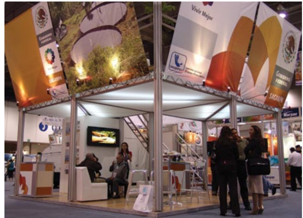
The Business Lounge, set up by the Federal Government through SAGARPA, provided an attractively designed space for suppliers and buyers to negotiate. El Lounge de Negocios, provisto por el Gobierno Federal a través de la SAGARPA, ofreció un espacio atractivamente diseñado para realizar negociaciones entre proveedores y compradores.

Pescamar 2008 ofreció una amplia variedad de pláticas cuya finalidad fue responder a los retos actuales en torno a la industria acuícola y pesquera de México. "Cambiar la imagen de la sardina"; "Bondades de la tilapia mexicana" y "La importancia de promoción pescados y mariscos" fueron sólo algunos de los temas abordados en estas conferencias.