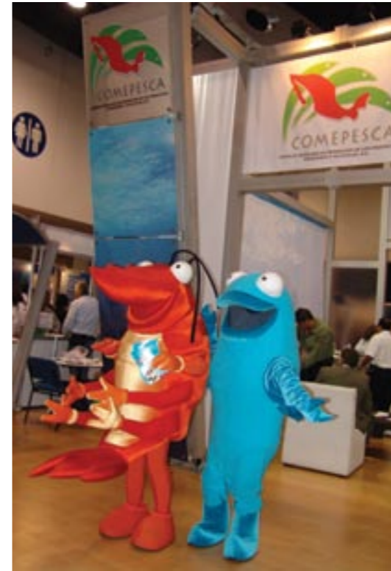
COMEPESCA's advertising characters: Mr. Shrimp and Mr. Fish Los personajes de la campaña promocional de COMEPESCA: Sr. Camarón y Sr. Pescado

En el marco de Exporestaurantes, conocido desde hace 8 años por ser la única exposición dedicada 100% a la industria restaurantera a nivel latinoamérica, del 2 al 4 de julio el World Trade Center, Ciudad de México fue la sede de la segunda edición de Pescamar.