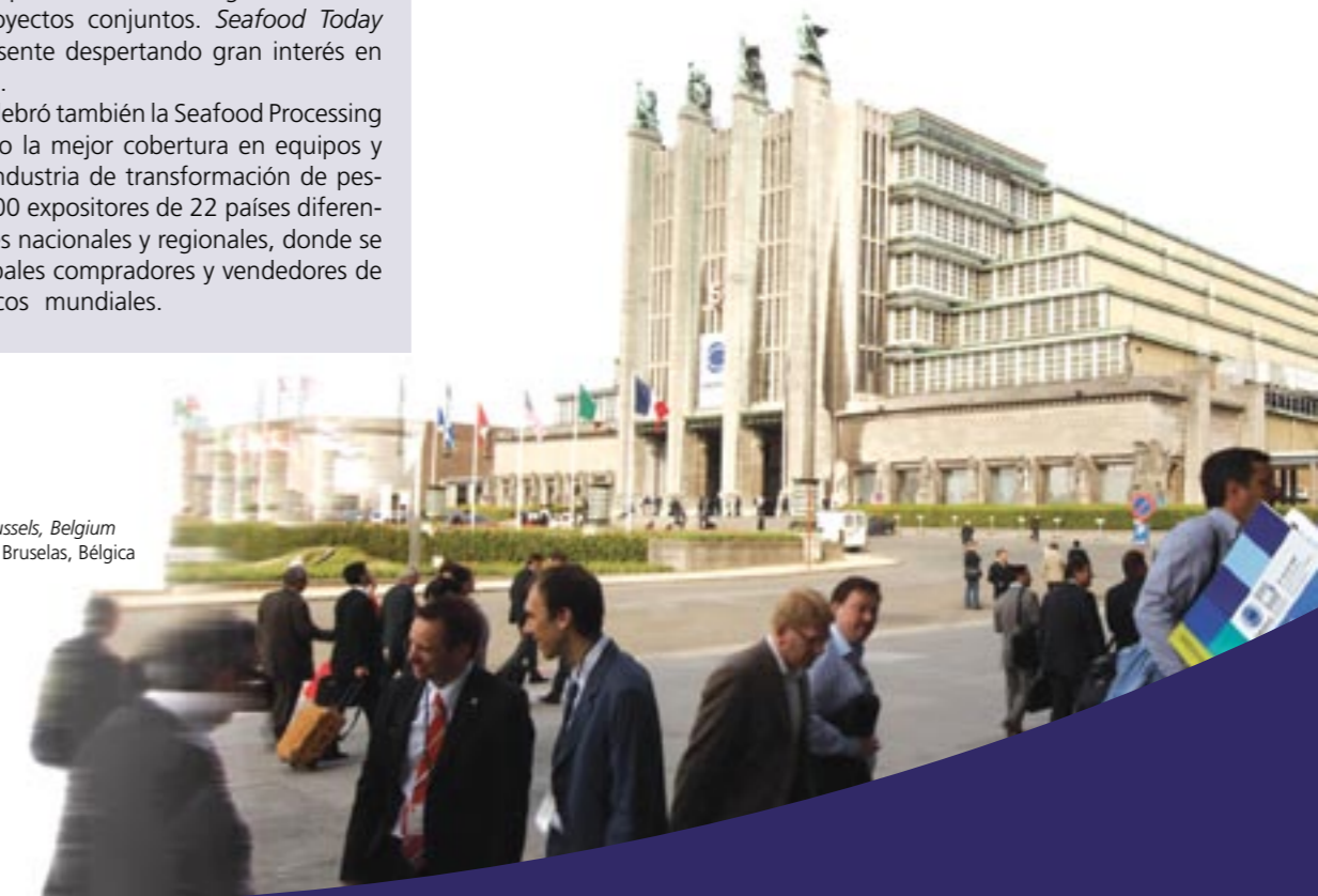
Parc des Expositions, Brussels, Belgium Centro de Exposiciones, Bruselas, Bélgica

La Comisión Europea, a través de su programa All Invest III, organizó el Encuentro Internacional de Negocios "Eurofish '08" en el marco de la Feria European Seafood Exposition en la ciudad de Bruselas, Bélgica, entre los días 22 al 24 de abril de 2008.