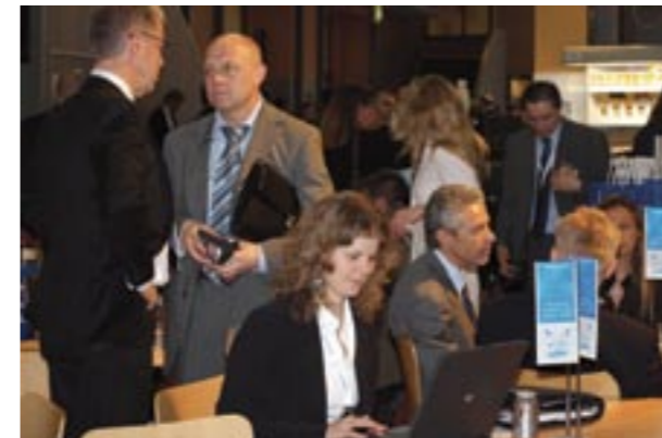
Over 1,600 exhibitors from more than 87 countries attend the ESE. En la ESE se dan cita más de 1,600 expositores provenientes de más de 87 países.