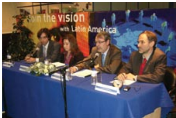
Official opening of EUROFISH '08. Apertura oficial de EUROFISH '08