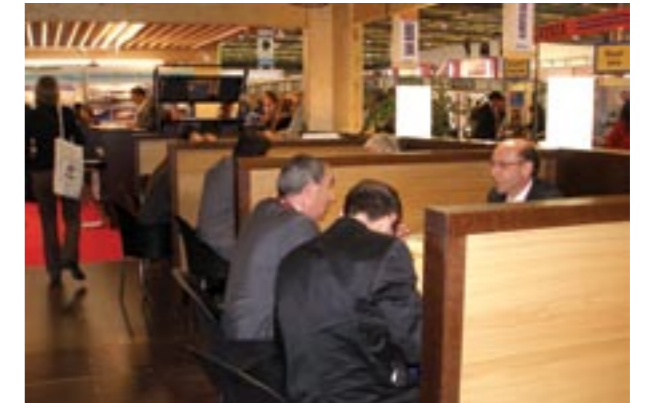
103 companies from over 19 countries participated for the purpose of finding cooperation to implement joint projects and enter into business opportunities. Se congregaron 103 empresas provenientes de más de 19 países con el fin de concretar oportunidades de negocios.

Sin duda, European Seafood Exposition es una de las ferias del sector de la pesca más importantes a nivel mundial. En ella se dan cita más de 1,600 expositores provenientes de más de 87 países.